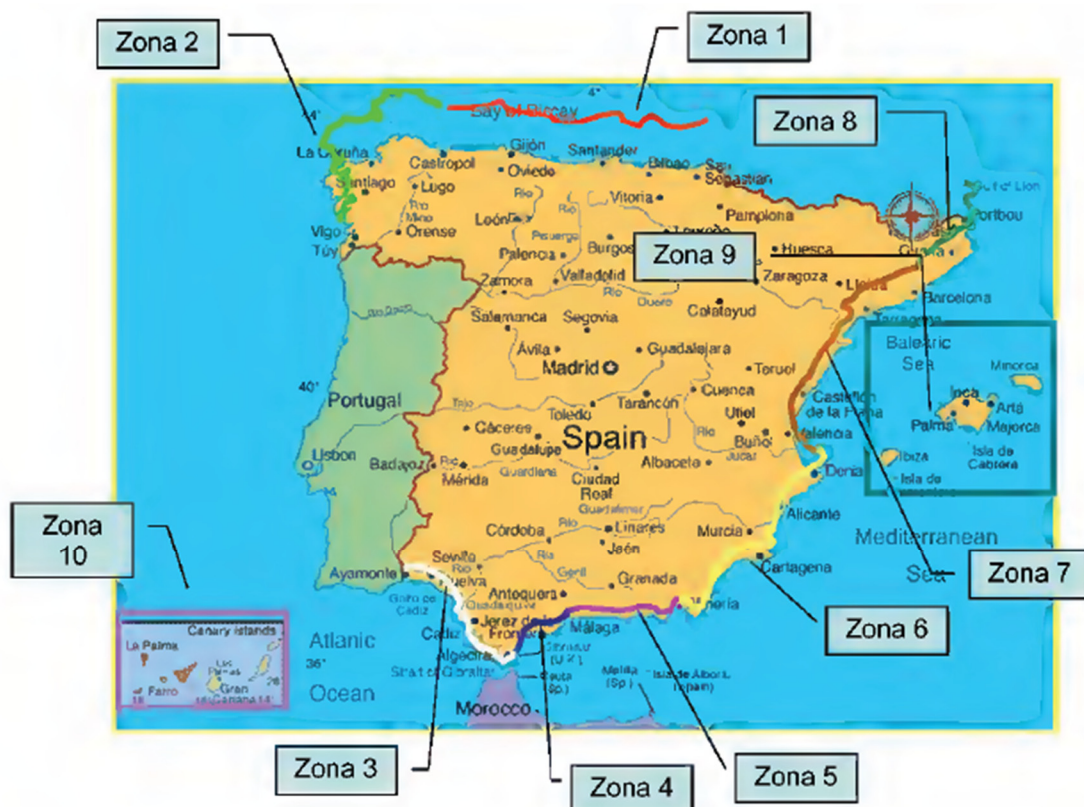
Zonificación del litoral Español. Fase II. Evaluación de Efectos en la Costa Española

En este documento se realiza en primer lugar una zonificación morfológica de las zonas de costa en función de sus elementos litorales, quedando la costa de Port Verd del T.M. Son Servera en la Zona 9, caracterizada por una costa rocosa de baja cota con playas encajadas.